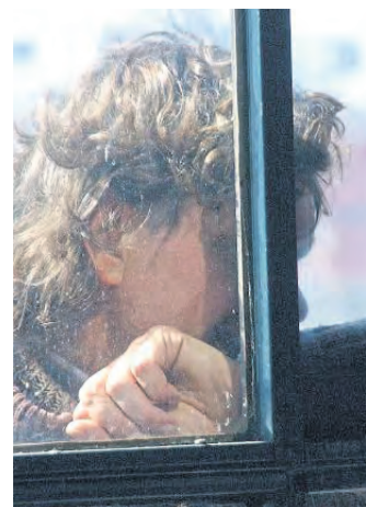
Die steigenden Abschiebezahlen führen dazu, dass Kirchengemeinden häufiger handeln.

Diese Form des Schutzes hat eine lange Tradition. Kirchenasyl ist unbequem. Es stellt Fragen und fordert heraus. Aber es erinnert uns daran, dass Menschlichkeit dort beginnt, wo jemand sagt: Du bist hier nicht allein.