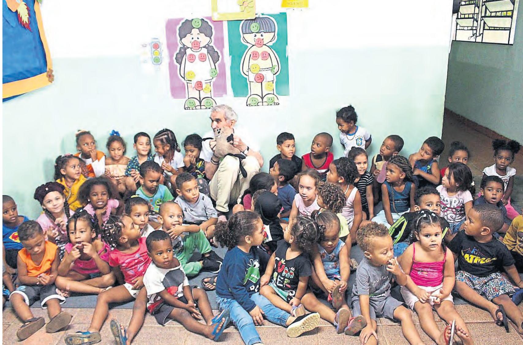
Gemeinsam stark: Kinder und Jugendliche von Avicres – jedes Gesicht eine Geschichte, jede Zukunft kostbar.