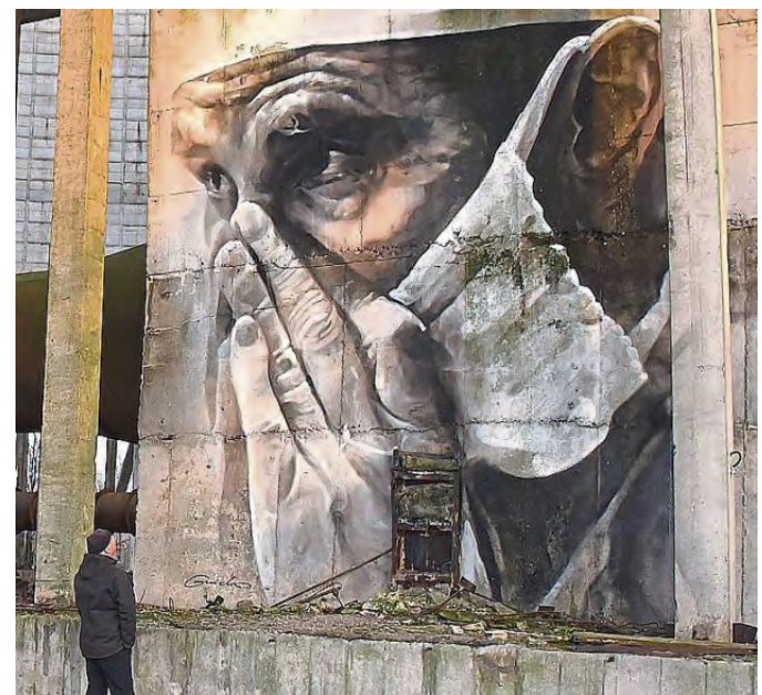
Sinnbild vor Ort in XXL: Tschernobyl steht für eine der schlimmsten Unfälle in der Atomenergie.

Mit einem Geigerzähler bewaffnet dokumentierte Tu-