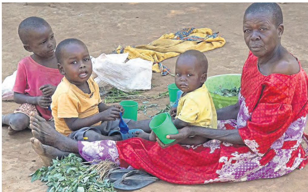
Ganze Dorfgemeinschaften wurden getroffen, Existenzen ausgelöscht, Hoffnung verbrannt.