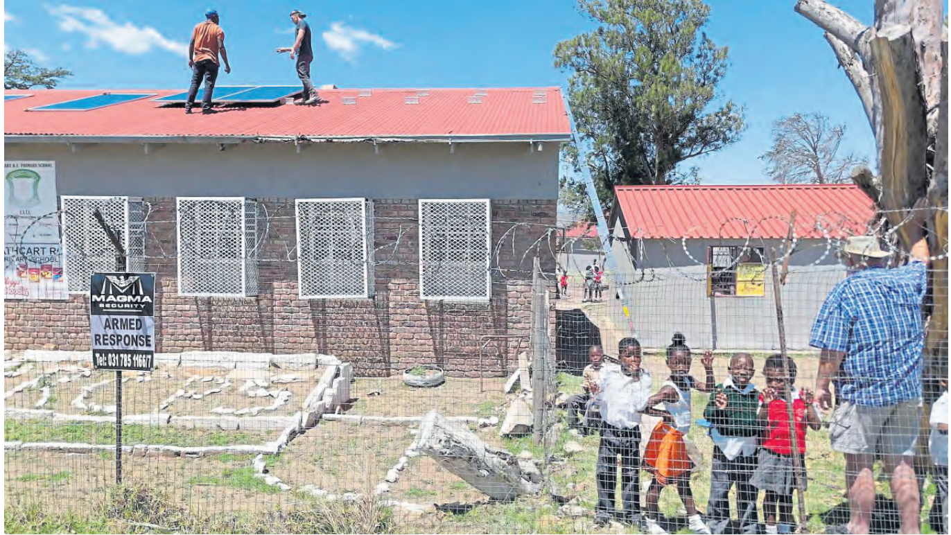
Die Solaranlage bedeutet Stabilität, Verlässlichkeit und neue Perspektiven für die gesamte Schulgemeinschaft.

Druck: Druckzentrum Hamm GmbH & Co. KG Erscheinungsweise: viermal im Jahr unentgeltlich