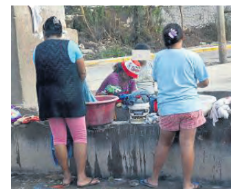
Bei der Hilfe geht um Lebensmittel- und Medikamentenversorgung, aber auch um seelsorgerliche Begleitung.

Die Mitarbeitenden und Partner des Hilfswerks stehen in engem Kontakt mit Gemeinden, Ordensleuten und Familien. Sie hören zu, sie begleiten, sie helfen dort, wo die Not am größten ist. Ihre Spenden fließen zu denen, die oft keine Stimme haben – zu Familien, die kaum genug zu essen haben, zu Kindern, die in Armut aufwachsen müssen, und zu älteren Menschen, die allein gelassen werden. Und sie schaffen Räume, in denen Menschen wieder Vertrauen fassen dürfen.